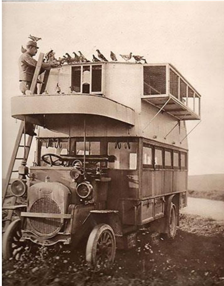
Motorizált mozgó dúc

Az állásháború kialakulása messzemenően visszaigazolta a postagalambok nélkülözhetetlenségét. Az első vonalakba telepített távbeszélő vezetékek a tüzéségi tűz következtében gyakorta megsérültek, használhatatlanná váltak. Ezért sokszor az egyetlen megbízható híradási lehetőséget a postagalambok biztosították. Az osztrák – magyar haderő német tapasztalatok alapján 1916–1917-ben építette ki a postagalamb-állomások hálózatát. Az alapegységet a mozgó dúccal rendelkező, 60 galambból, 1 tisztből - aki a parancsnoki beosztást töltötte be –, 1 fő gondozóból, valamint 2 fő küldőncből álló postagalambszakasz jelentette. Minden hadosztály-parancsnokság mellé 1 postagalambszakaszt osztottak be. A dúcot a parancsnokság közelében meghatározott szabályok szerint telepítették, s innen küldőncök szállították a meghatározott ezredparancsnokságokhoz a 24 órás szolgálatra beosztott, általában 2 db galambot.