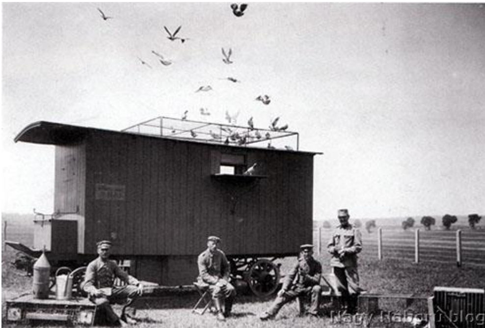
Postagalambcsapat visszatérése az állomásra. Orosz front, 1916 (Balla Tibor–Pollmann Ferenc–Kürti László: A Nagy Háború másik arca)

Természetesen az elhelyezésükről és az ellátásukról is pontosan rendelkeztek. A dúcot az üzenetek gyors kézbesítése érdekében a hadosztály-parancsnokság közelében telepítették, messze az út, a vasút zajától és megfelelő távolságban az esetlegesen működő tüzérség dőrejtől. Kerülték az elektromos vezetékek és magas fák közelségét is. Az elhelyezésnél előnyben részesítették a szabad kirepülést, illetve a gondozó számára szabad kilátás lehetőségét. A dúc gyakori mozgatását igyekeztek elkerülni. Amennyiben mégis elkerülhetetlenné vált, a galambok az új környezethez való szoktatása 2-3 hétbe telt.