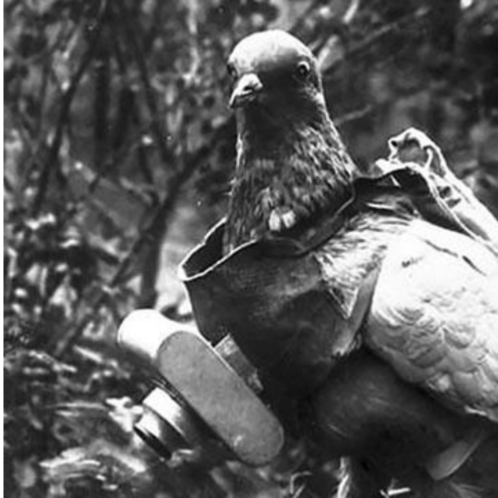
Postagalamb kamerával

Az első világháború során a postagalambok nélkülözhetlenségüket bizonyították a hadsereg szolgálatában. Ezért az 1922-ben újjáalakuló m. kir. Honvédség is rendszerben tartotta őket. Minden híradó ezred rendelkezett egy postagalamb századdal. A polgári galambtenyésztő egyesületek élére pedig általában katonatiszt került. A honvédség pontos nyilvántartást vezetett a tenyésztőkről és állományaikról.