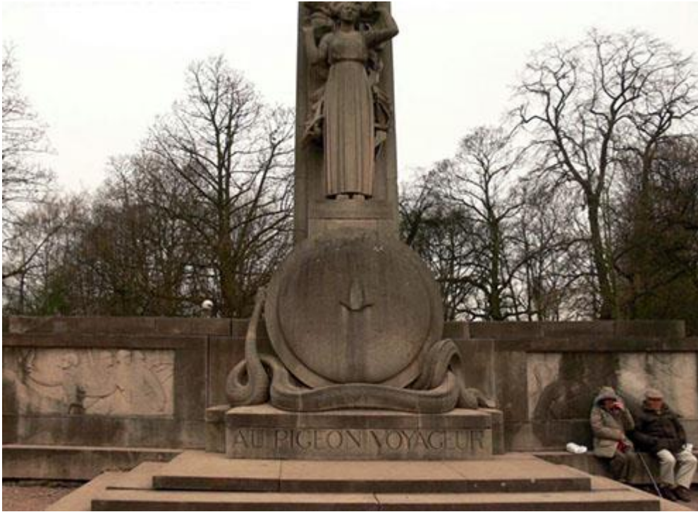
Az első világháborúban szolgálatot teljesített postagalambok emlékműve a franciaországi Lille-ben